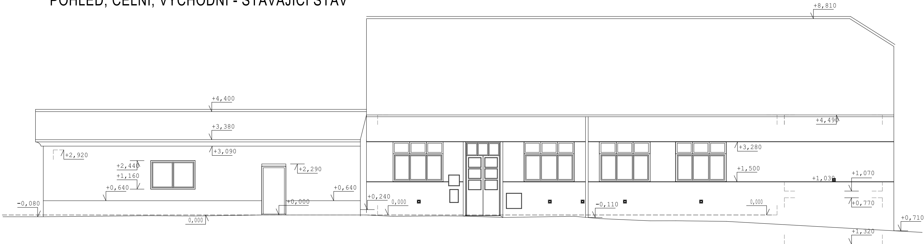
POHLED, ČELNÍ, VÝCHODNÍ - STÁVAJÍCÍ STAV

Klempířské výrobky - pozinkový plech, reaktivní nátěr, imitace mědi Komín - bílá strukturovaná omítka, betonová hlava Dveře - plastové, prosklené, rám bílá barva, Okna - plastové, prosklené, rám bílá barva, Střešní okna - dřevěná, poplastovaná, tmavé venkovní lemování; Tesařské výrobky - nátěr odstín teak, olejový nátěr